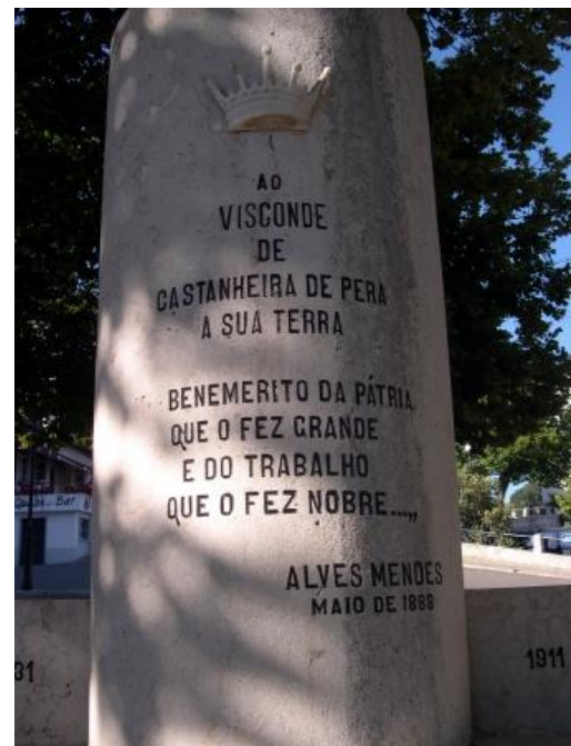
Monumento ao Visconde em Castanheira de Pera.